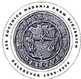
Historyczna pieczęć Daleszyc z 1789 roku