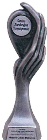
Gmina Atrakcyjna Turystycznie w Plebiscycie „Orły Polskiego Samorządu 2017”