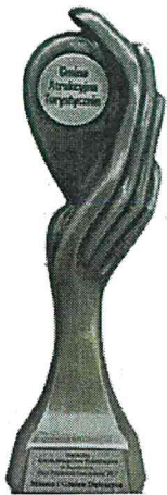
Gmina Atrakcyjna Turystycznie w Plebiscycie „Orły Polskiego Samorządu 2017”