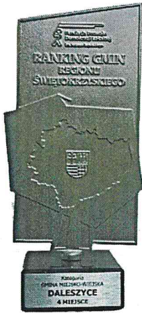
4. Miejsce w Rankingu Gmin Regionu Świętokrzyskiego w kategorii „Gmina Miejsko-Wiejska” Kielce 2021